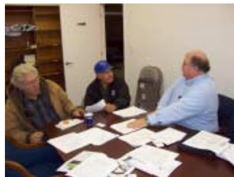
Clase impartida en el Small Business Incubator del RCDR

Este es uno de los programas que ha tenido menos acceso por productores minoritarios ya que es altamente competitivo naturalmente entre agricultura corporativa y operaciones de negocios.